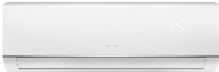
Σειρά Delfin | DC Inverter